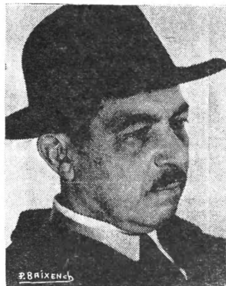
Pedro Henríquez Ureña

Se agolparon los pasajeros, que a esa hora son muchísimos. Mientras lo sostenía, pedí que buscaran un médico. Lo hallaron y vino, pero todo fué inútil. Nuestro amigo no dió ninguna otra señal de vida. El diag-