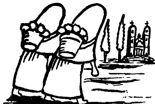
Camino a la Iglesia

Si es lejano el origen, más cercana es la tierra. El pasado edifica tu más puro presente y hoy te vemos colmando la luz de la mañana. Oh ciudad del color de los montes, que tienes los ojos del agua, la piel del verano y el olor de las rosas antiguas: recibe mi canto y el envío desprenda un saludo cordial de laureles.