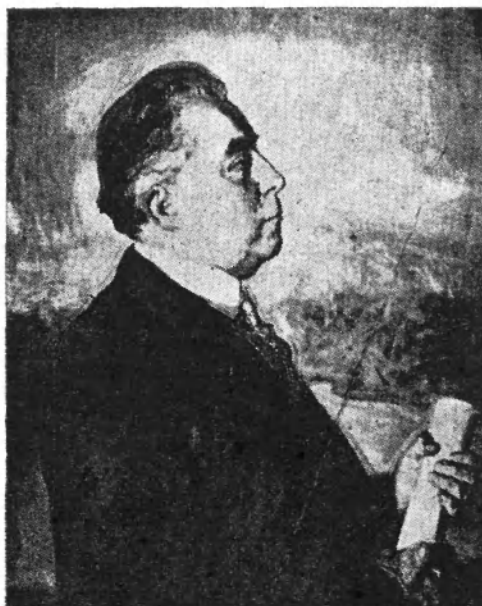
José Santos Chocano

Estamos empeñados, una famosa editorial y yo, en reunir toda la obra de Chocano, de José Santos Chocano, en prosa y