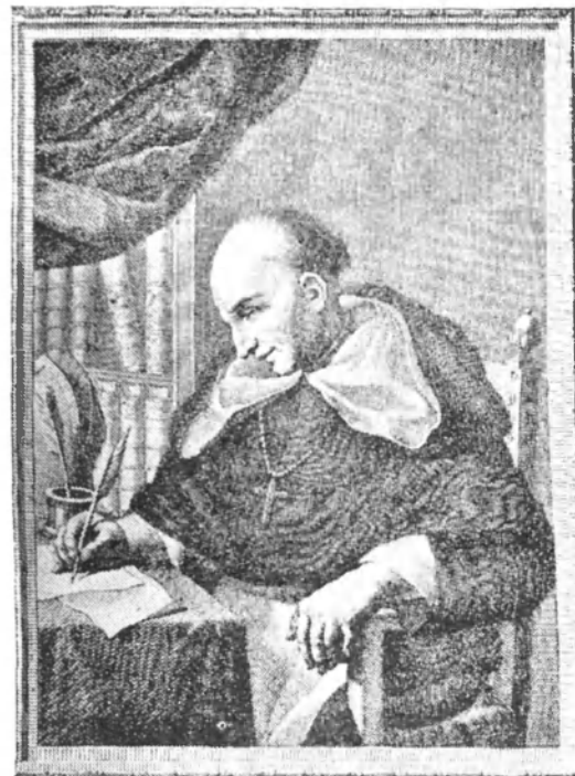
Bartolomé de las Casas