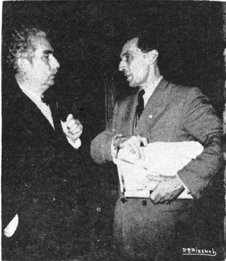
En un receso del Congreso Mundial de la Paz, efectuado en Varsovia, cambian impresiones Federico Joliot Curie, Presidente del Consejo Mundial de la Paz y Juan Marinello, miembro de ese organismo.

ción grandiosa de Varsovia. Y esa adhesión del pueblo acompañó el Congreso día a día, noche a noche, minuto a minuto. No importaba que los trabajos terminaran, como sucedió con frecuencia, rayando el alba. Al salir los delegados las multitudes esperaban a pie firme —bajo la lluvia y con fría temperatura bajo cero casi siempre—, para elevar su alegre grito unánime: pocúú, pocúú, pocúú : paz, paz, paz.