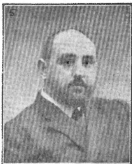
Don Angel Ossorio y Gallardo Gobernador de Barcelona