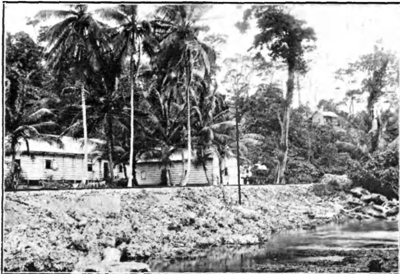
Costa Rica.—Una vista en la Costa del Atlántico