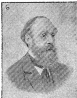
Don Eusebio Güell Distinguida personalidad catalana