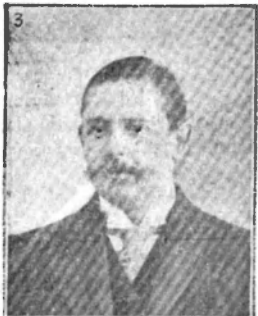
Duque de Bivona Ex-Gobernador de Barcelona

dientes á los cinco atentados; diez años y un día de presidio mayor por su responsabilidad en el atentado en que no se verificó la explosión; y cuatro meses de arresto mayor por cada delito de estafa.