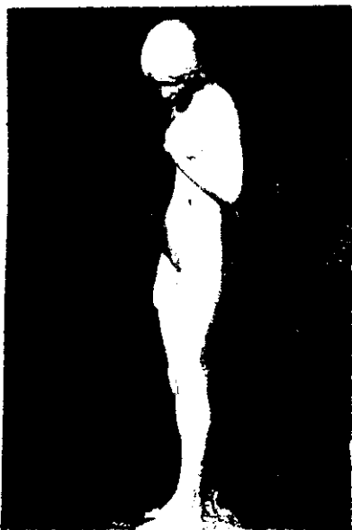
MUSEO NACIONAL.—Carl J. Eldh.—LA INOCENCIA

á la mesa, cerró los ojos con lentitud, sonrióse y la oyeron murmurar: «Que bueno estaba aquello!» El cocinero la dijo: «Golosa!»