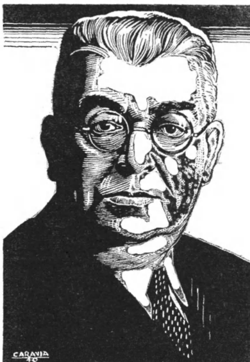
Fernando Ortiz (1941)

De otra fórmula, indefinido, nadie tiene flus para hablar de cultura, que es milicia. Que callen los acomodados en el colchón de la neutralidad. La voz es para los militantes, para los agredidos, para los agresivos. Y ese es el grupo sanguíneo de Ortiz. No se elige por deporte una existencia tan asaltada de problemas. Viene con el temperamento y se la siente como imperativo, como espuela, más cuando la herencia de José Martí golpea a diario como un mandato.