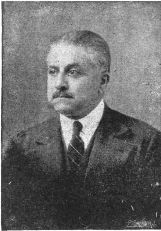
Manuel Ugarte (1928)