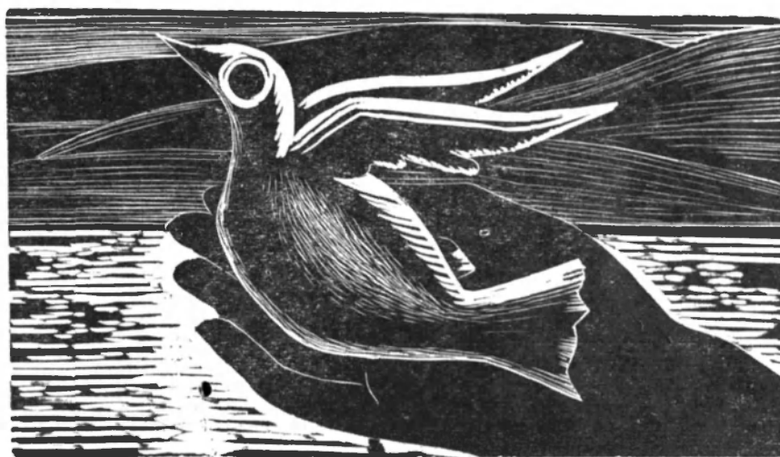
(Ilustración de Amighetti)

la desesperación. El hombre debe encontrarse consigo mismo y se encontrará al fin, pero sólo cuando llegue a suprimir las ilusiones o engaños del individualismo cerrado y del colectivismo neutro, cuando se busque por el camino del otro. El hecho humano fundamental no es el individuo solitario ni la colectividad, sino el hombre con el hombre, lo que denomina Buber el fenómeno del entre , que ocurre cada vez que entre el yo y el tú se establece una relación íntima y veraz, que puede ser de armonía o de pugna, y que es la condición inexcusable para que cada uno se halle a sí mismo y halle a los demás. La antinomia entre el individualismo y el colectivismo se le aparece como falaz y transitoria. En la relación del entre , en el descubrimiento del semejante y el consecutivo hallazgo real del yo, residen la conciliación del individualismo y el colectivismo y la posibilidad de una ajustada comprensión de lo humano, que no se cumple sino cuando el "uno se encuentra con el otro".