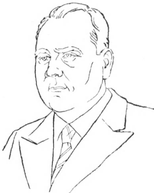
Francisco Romero.

circunstancia de los que se mataron en flor en aquel campo por no poseer los sólidos principios de una ética política". Francisco Romero, que no sólo especula y teoriza, sino que también practica y vive lo que expone, respondió: "Porque después de las luchas por la vigencia de las ideas y doctrinas salvadoras del hombre en su integridad moral, lo único que prevalece y se impone a todo y a todos, es la conducta recta, es el superar el estado biológico para ser libre y entero". El maestro se iluminó al expresar este pensamiento. Su saber, su angustia, están al servicio de una Argentina grande, creadora, y de una América resuelta a significarse como verdad histórica y cultural. Francisco Romero, ya en la cátedra, ya en la tribuna, ya en el periódico o revista, ya en el libro, ha contribuido a la solución de las incógnitas del hombre, para responsabilizarlo