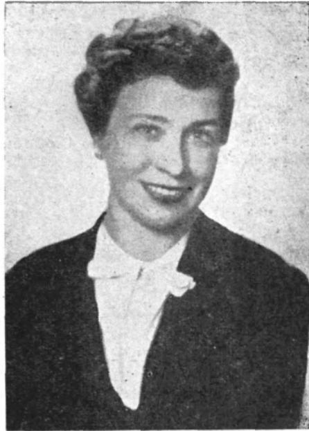
Blanca Luz Brum (1952)

Blanca Luz Brum es nervio y pasión desde el título de su libro iniciador, Las llaves ardientes , 1925. Es siempre nervio y pasión. La inflama un quemante y abarcador anhelo de justicia; los innumerables dolorosos y preteridos —de no importa qué latitud— tienen un lugar en su sentimiento. La primera iniquidad de que fué testigo esta criatura toda espontaneidad e impulso, la encendió en cólera y puso en su garganta un reto; los años pasan y su indignación no declina, pues la alimentan sucesos sublevantes que se suceden sin interrupción. Estallando de esa ira, ha peregrina-