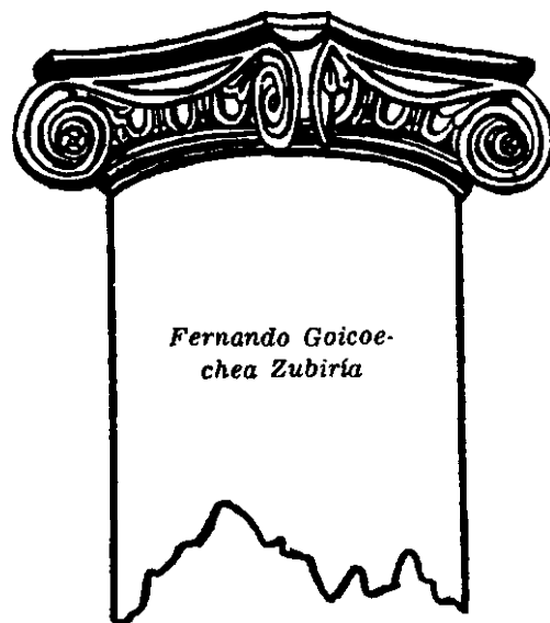
Esta es la columna miliaria del Repertorio Americano.

de Puerto Rico al Presidente de Estados Unidos, cursado el lunes, 31 de marzo de 1952, con motivo de haber hecho pública el Presidente su decisión de no postularse co-