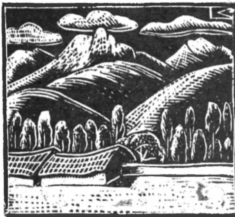
Huaras. San Cristóbal. Por Camino Sánchez. Perú. 1939.