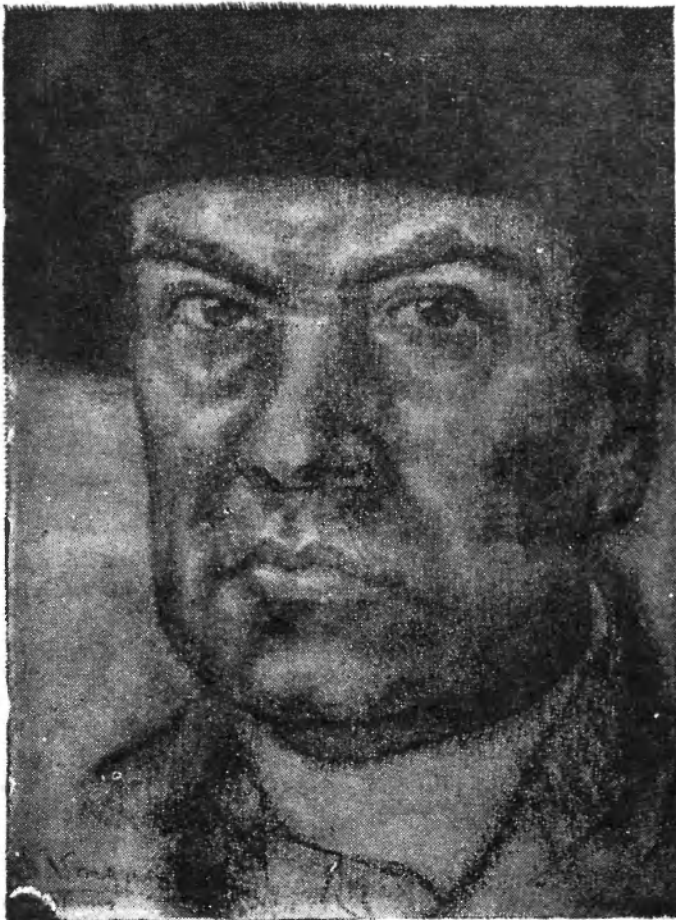
Rubén Darío (Por Vásquez Díaz).

Centroamérica espera que le den su guirnalda y su bandera Centroamérica grita que le duelen sus miembros arrancados, y aguarda con ardor la hora bendita de verlos recobrados.