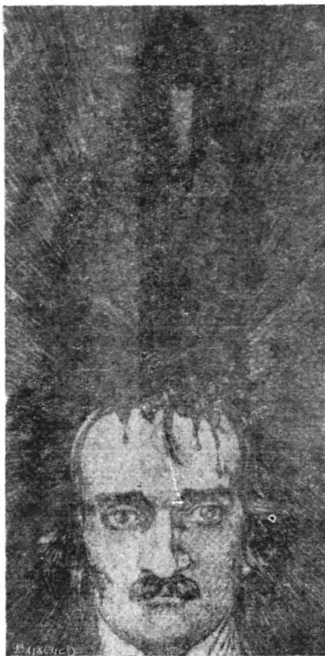
Edgar Allan Poe

Pero volvamos a los poetas. El llamado modernismo, con Rubén Darío a la cabeza, rindió insistente culto a Poe. Manuel Gutiérrez Nájera, el poeta más destacado de los primeros años del movimiento, no fué en realidad, como los interesados quieren ver, un poseído de Poe. Cierto que no debió ignorar las versiones de El Cuervo , Lenore y acaso de Annabel Lee ; pero no es menos cierto que Gutiérrez Nájera no mostraba por la literatura de lengua inglesa la pasión que demostró por la francesa, y la Revista Azul , cuyas reproducciones extranjeras forman una intensa antología de sus preferencias y las de su grupo, no pu