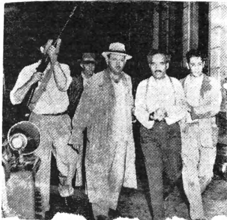
Fotografía histórica: Albizu Campos, esposado, y conducido al Cuartel General de la Policía. A la derecha, un teniente ; a la izquierda, un detective .