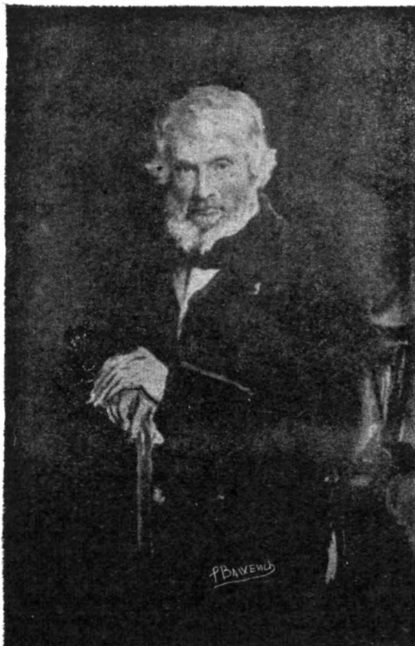
Tomás Carlyle (Por Sir John Millais).

Existen, en realidad, hombres que tratan de persuadirse y de persuadir a otros de que conocen acerca de cosas en las que no han podido penetrar más allá de su corteza externa y, sin embargo, con ello prosperan en el mundo. Evitad todo lo que es indigno de un hábito de honradez. Sed modestos y humildes y