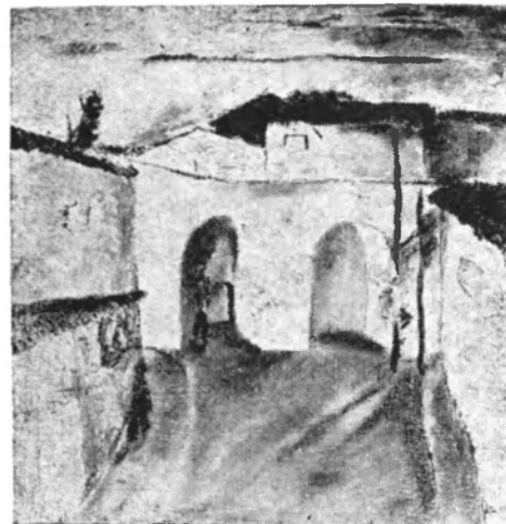
Boquetes en Sancti-Spiritus (Por Felipe Orlando).

y al tratar de olvidar lo que era antes sus recuerdos son penas que retumban con el vómito hirviente de su sangre? (Junio de 1950).