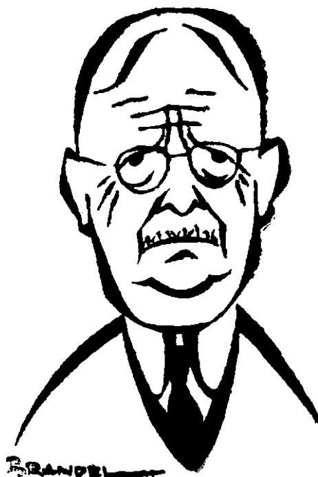
Mr. John Dewey