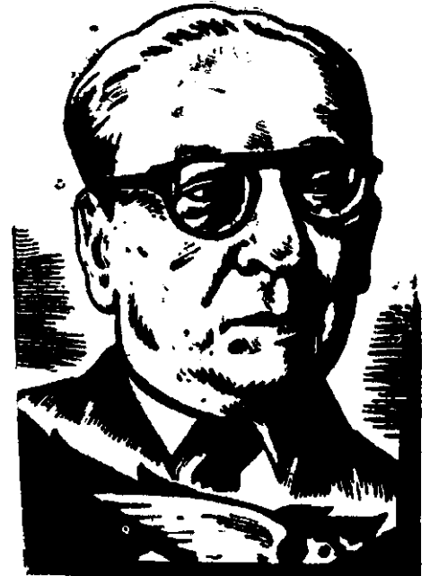
Enrique González Martínez Por Alberto Beltrán

Pero, aunque sea éste un homenaje a la vida que conserva esencial fidelidad a si