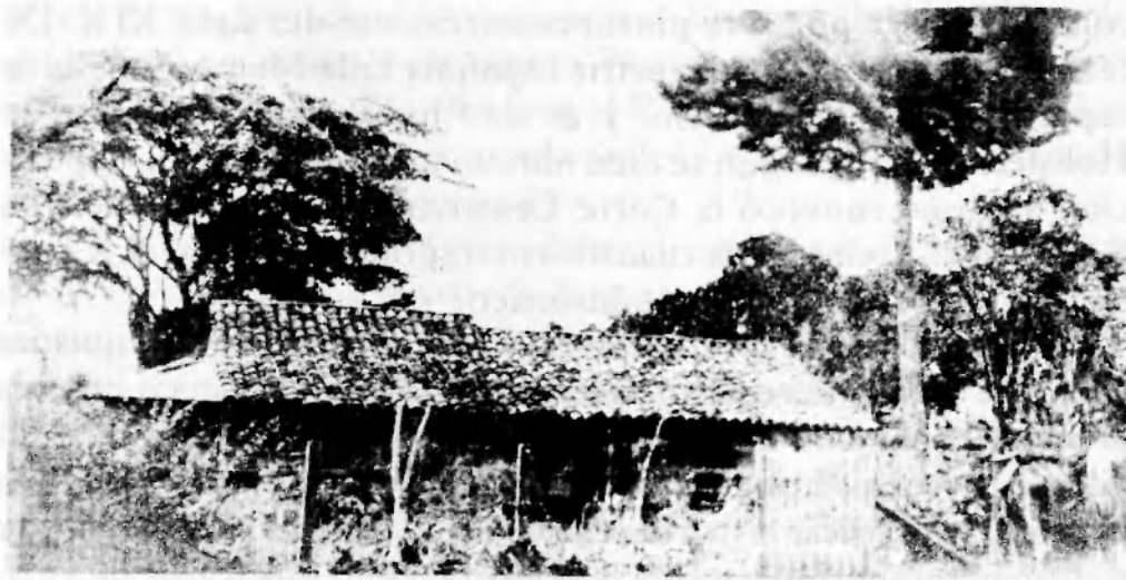
Casa donde nació el poeta Lisímaco Chavarría, en San Ramón.