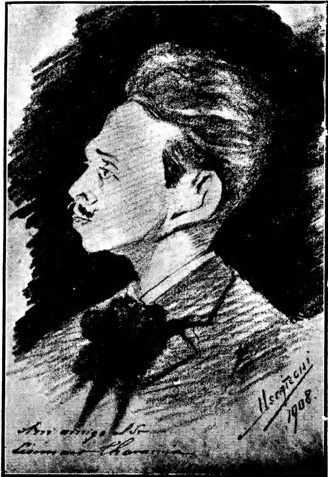
Caricatura de Lisímaco Chavarría, por Uscátegui, (1908).