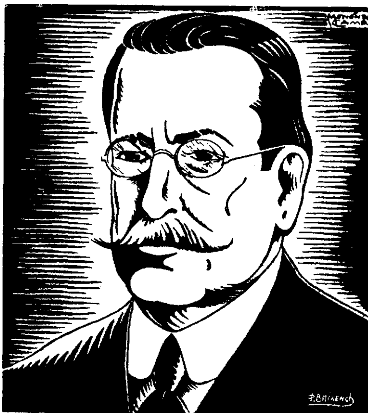
José Enrique Rodó

(En El Nacional de México, D. F. Junio 28 de 1950).