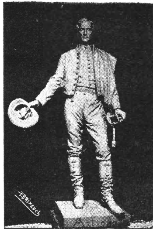
Estatua de Juan M. Blanes , erigida en gran parte de los pueblos de América.

La batalla de Las Piedras fué tan decisiva que los españoles perdieron el interior, quedando encerrados en la plaza de Montevideo. Y al convencerse todos de que Artigas era tan incorruptible a las promesas de sus adversarios como a las injusticias de la Junta, los sitiados pidieron auxilio a la corte de Portugal, entonces exilada en Río de Janeiro, pro-