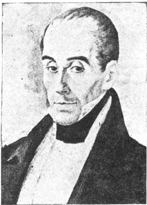
Simón Bolívar en 1830 (Estudio de Michelena).