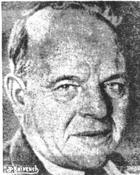
Jaim Najman Bialic

Palestina", especie de manifiesto que causó honda impresión entre los dirigentes del movimiento sionista. Da a luz su hermoso poema, El Hatzippor (al Pajarillo), que es recibido encomiásticamente por la crítica. Muere el abuelo "cuyas pupilas, cubiertas con la ceniza del tiempo y el polvo de pergaminos seculares, animáronse muchas veces con una chispa de ternura hacia ese retoño de su carne, sensible e inteligente, al que consideraba como el heredero de su alma". Se casa en Zhitimir con la hija de un acaudalado comerciante, y durante cuatro años se dedica al negocio de maderas en la provincia de Kiev.