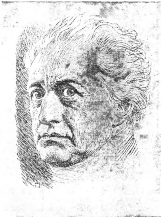
Goethe