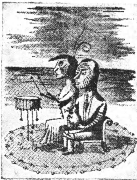
Los intelectuales en su aislamiento

(En El Tiempo de Bogotá. 11 Julio de 1949).