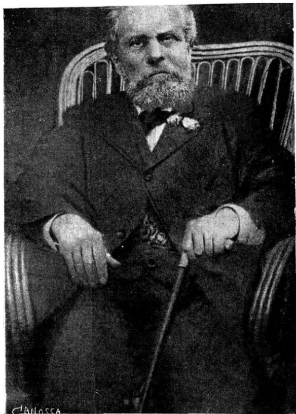
JOSUÉ CARDUCCI 1836-1907